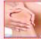
હાડકા ના દર્દ