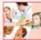
નાક, કાન, ગળાની ચિકિત્સા