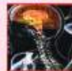
મગજના દર્દ, ફીટ, કંપવાત ચક્કર,