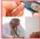
ડાયાબીટીસ, બ્લડ પ્રેસર, ડેંગ્યુ, મલેરિયાની તપાસ