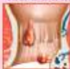
પાર્શ્વ, ફીસર, કોમ્પ્યુટર દર્દો, કાર્ડિયોલોજી, સ્પોન્ડાઇટીસ ગોલ ડેલેડર કીડની સ્ટોન